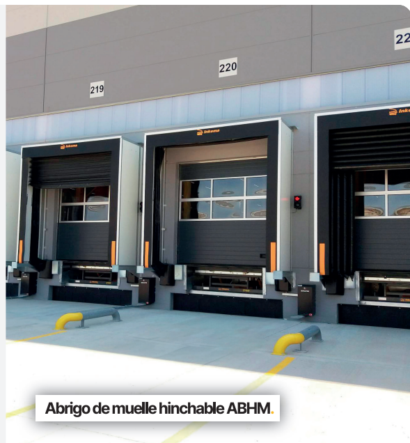
Abrigo de muelle hinchable ABHM.

Todos los abrigos de muelle de Inkema ofrecen diversas prestaciones opcionales que permiten a sus clientes personalizar el abrigo.