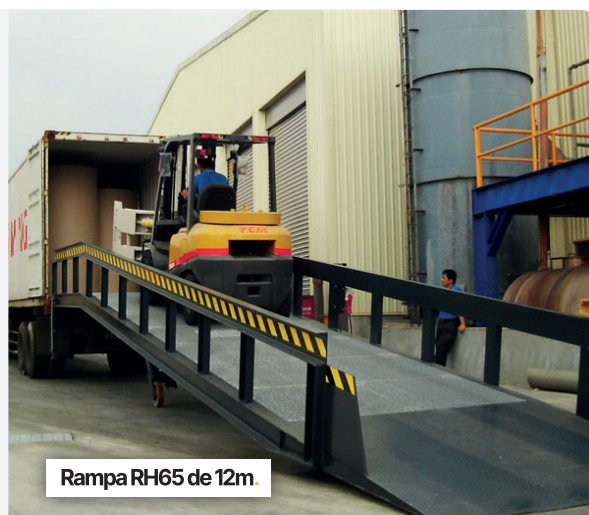
Rampa RH65 de 12m.

Consúltanos si necesitas otro tipo de rampa de carga especial. Estudiaremos el caso y encontraremos una solución adaptada para tu necesidad.